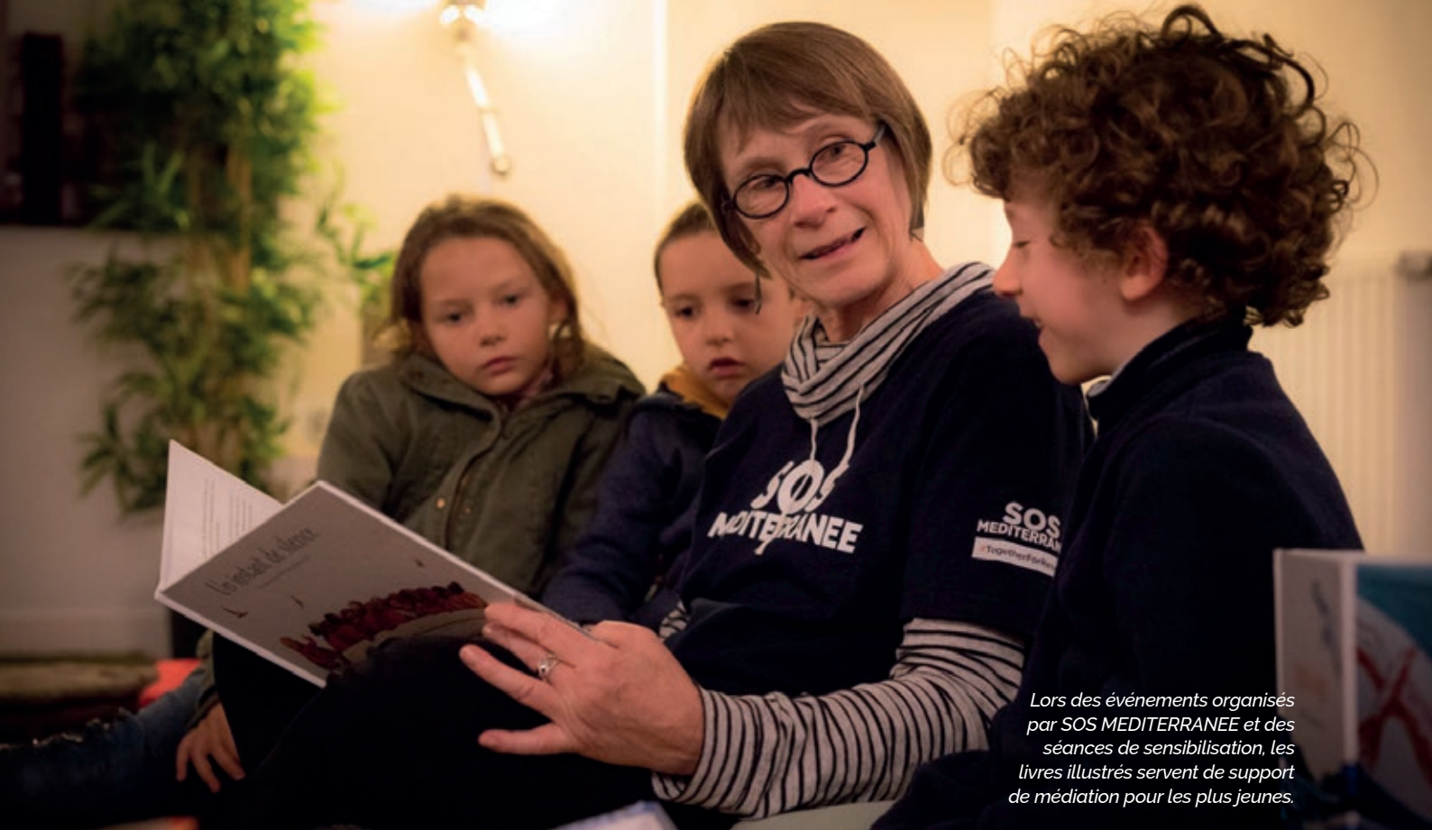
Lors des événements organisés par SOS MEDITERRANEE et des séances de sensibilisation, les livres illustrés servent de support de médiation pour les plus jeunes.