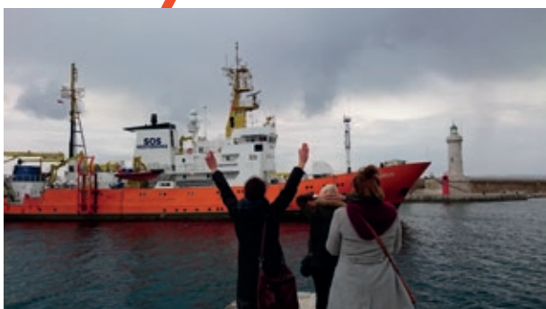
L'Aquarius entre au port de Marseille sous le regard médusé de quelques bénévoles.