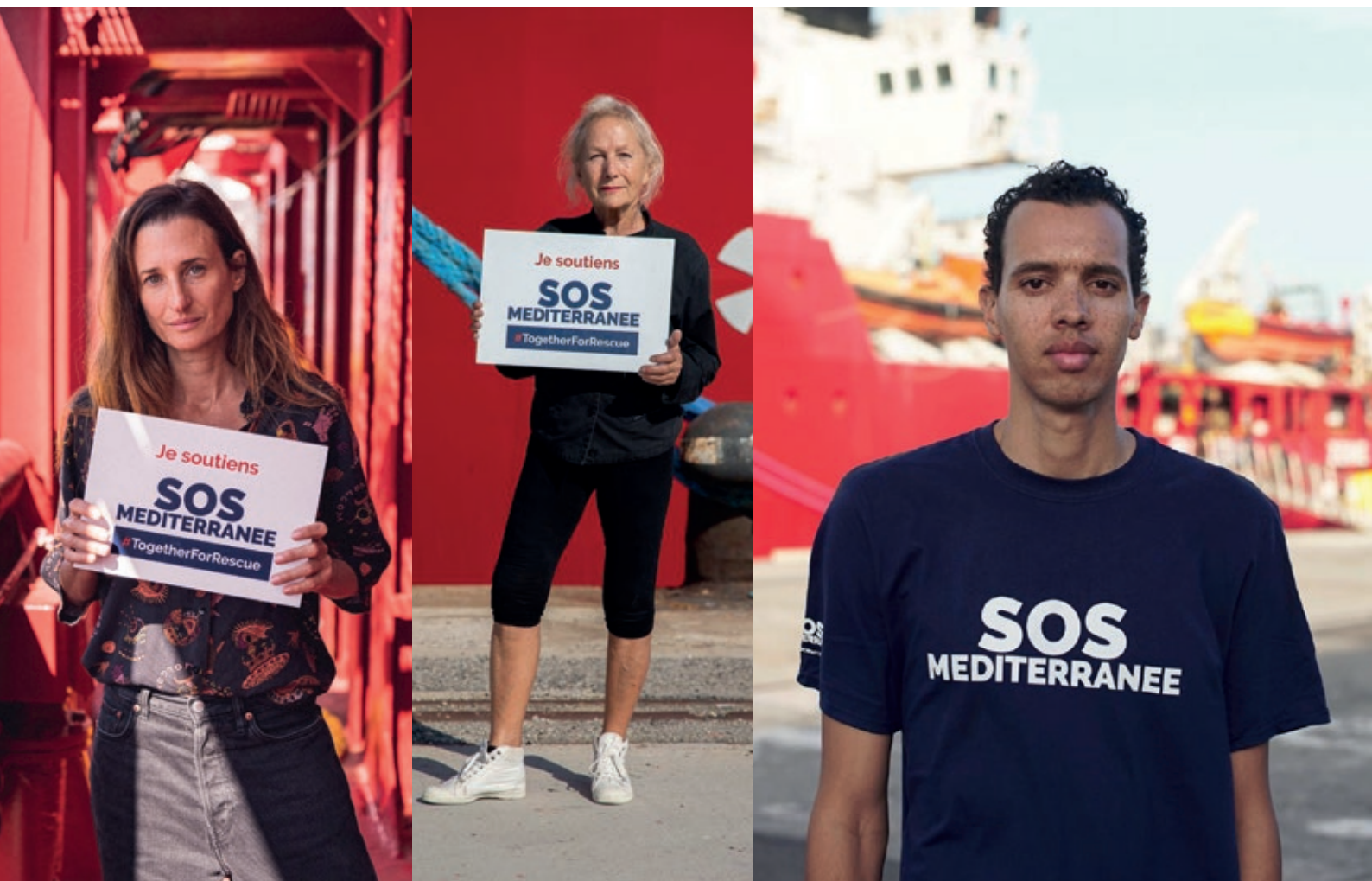
De gauche à droite Camille Cottin, Agnès B et Gaël Faye lors de la visite de l'Ocean Viking

rescapé.e.s. François Gabart s'implique dans une campagne de collecte de dons. Thomas Picketty livre une analyse sur la question des migrations, Charline Vanhoenacker parle de nous dans ses chroniques... Les musicien.ne.s s'engagent : le groupe Madame Monsieur , avec sa chanson Mercy – en l'honneur d'une petite fille née à bord de l' Aquarius – défend les couleurs de la France à l'Eurovision ; Imhotep, du groupe IAM , produit un album avec un grand nombre d'artistes dont les recettes sont reversées à SOS MEDITERRANEE . Les exemples d'engagement sont nombreux ! Et dans le document que vous lisez, c'est la célèbre dessinatrice de BD Pénélope Bagieu qui a fait les illustrations.